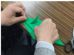
(最初の折り方こそ鶴の折り方に似ていますが・・・)